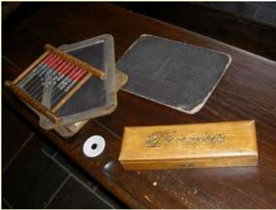
Des ardoises d'école

Te voici devant l'église Saint-Maclou. Chaque année, au mois de septembre, la fête des Berlouffes est organisée à Wattrelos. Plusieurs centaines de personnes viennent sur cette place pour attraper les objets lancés depuis le clocher de l'église. Que jette-t-on lors de cette fête? Entoure la bonne réponse.