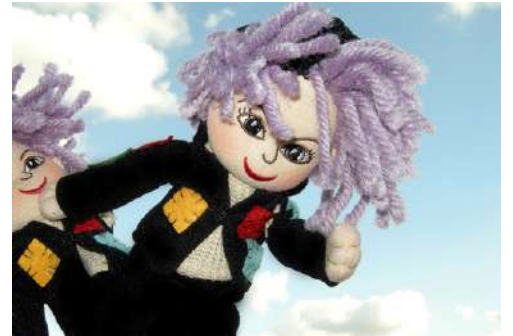
Des poupées Berlouffes