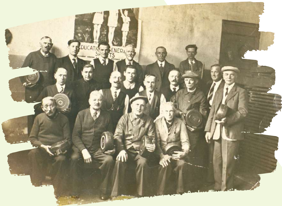
Joueurs de bourle, appelés bourleux, au début du XXème siècle à Wattrelos

Ainsi Wattrelos, tout comme ses voisines Roubaix et Tourcoing, va devenir l'un des grands centres de la pratique de la bourle, avec jusqu'à 200 bourloires réparties dans l'ensemble de la ville.