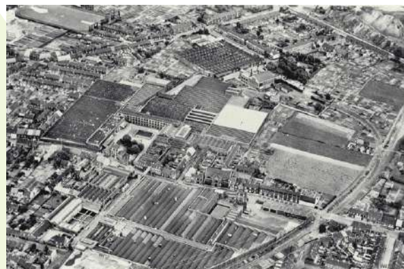
Vue aérienne des Entreprises Leclercq-Dupire

Dans la seconde moitié du XIXème siècle, la ville va connaître une période d'essor avec l'installation des usines de textile, qui vont attirer une importante main d'œuvre. Cette activité va venir compléter les revenus tirés de l'agriculture et du tissage à domicile. En effet, la ville compte, depuis le XIVème siècle, de très nombreux tisserands à domicile, qui vont peu à peu gagner les usines qui proposent des salaires plus élevés.