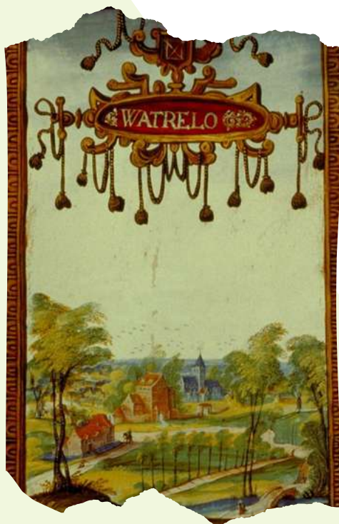
Gouache sur parchemin extraite d'un album de vues des bourgs de Flandre réalisée à la demande du Duc Charles de Croÿ (datant de 1596-1612).

Bienvenue à vous et partons ensemble à la découverte de la campagne wattrelosienne. Avant de débiter notre visite, voici en quelques mots l'histoire de Wattrelos.