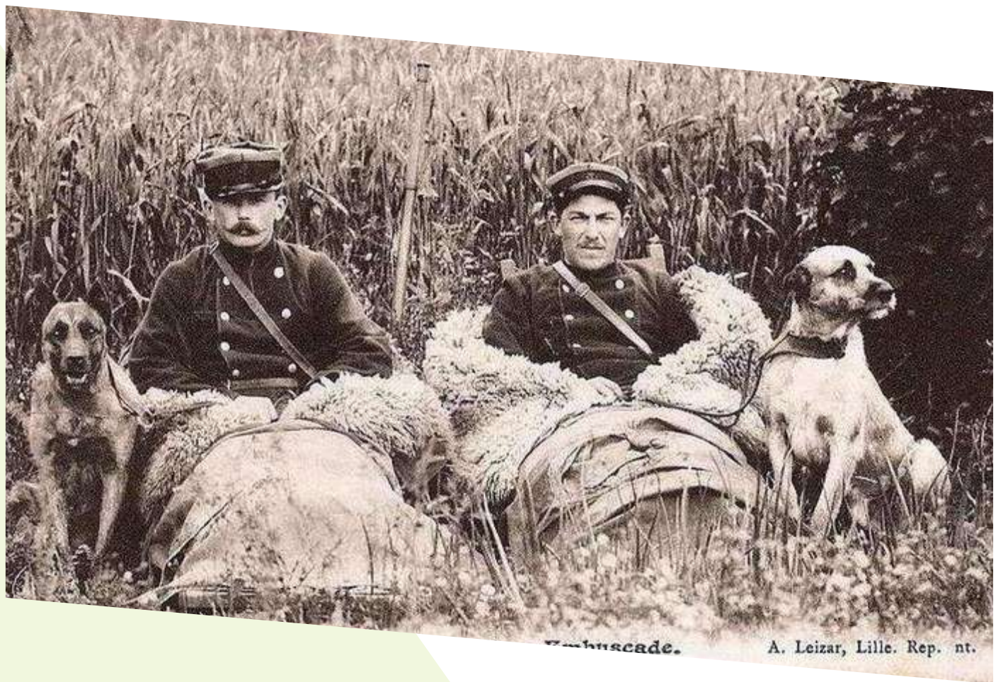
Les douaniers surveillent le passage de la frontière en se dissimulant à la vue des contrebandiers.