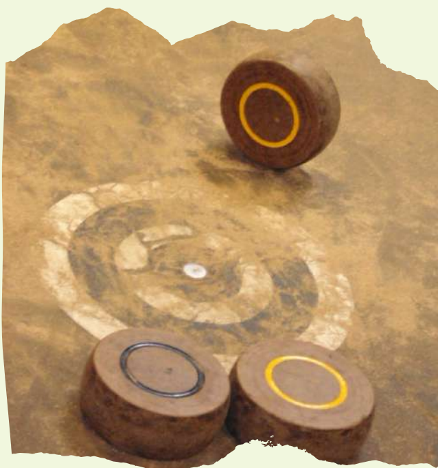
Votre bourle doit arriver le plus près de l'étaque (rond au centre de la photo)

Deux équipes composées de 2 à 6 joueurs sont constituées d'un commandant, de pointeurs et de frappeurs. Un match amical se joue en 6 ou 8 points. Le but est de placer ses bourles le plus près de l'étaque, matérialisée par une pièce métallique incrustée aux extrémités de la piste. L'équipe gagnant le tirage au sort a le droit de choisir sa couleur et de débiter la rencontre.