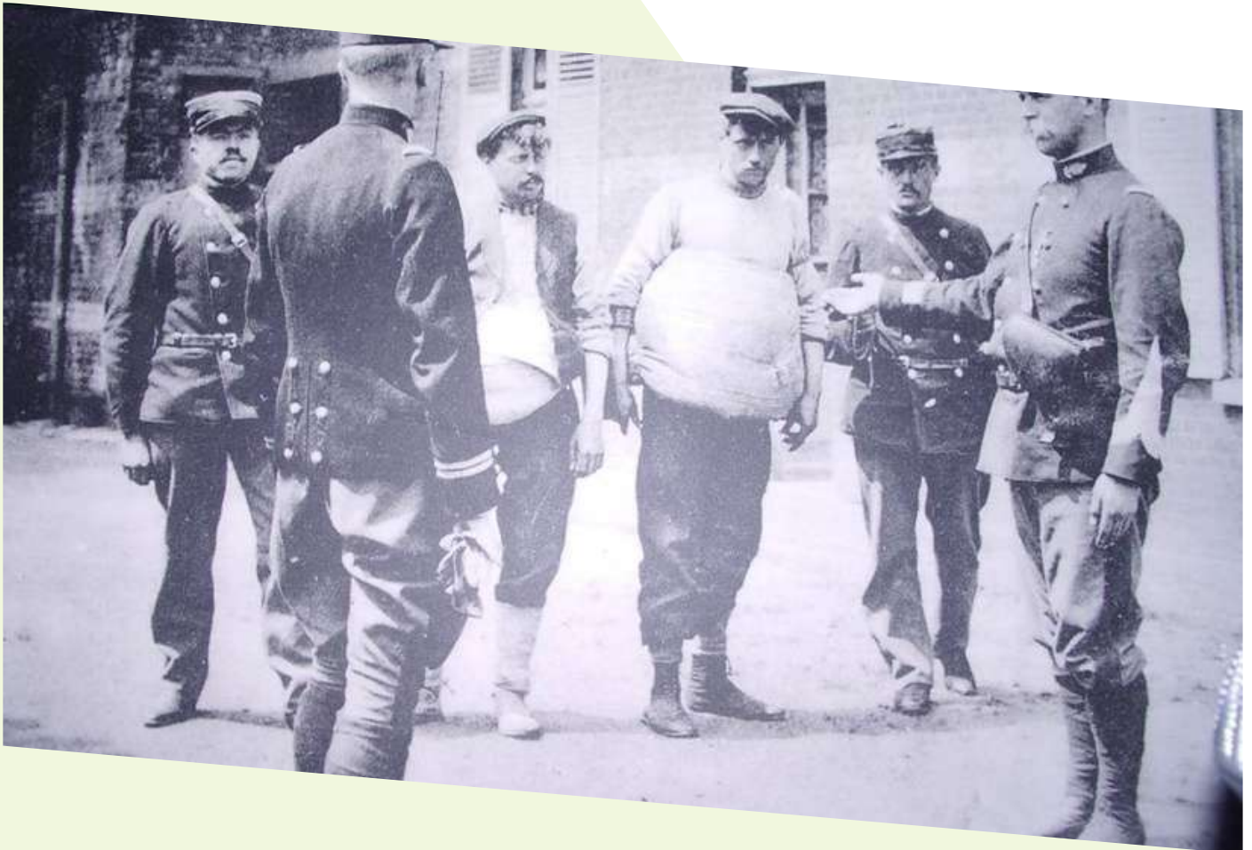
Les contrebandiers utilisent toutes sortes de subterfuges pour dissimuler les marchandises qu'ils passent en fraude.

Cette zone frontalière en pleine campagne permettait de passer la frontière très facilement. C'est en effet un véritable jeu du chat et de la souris que se livrent les douaniers et les contrebandiers, poussant ainsi les douaniers à rester cachés dans les champs pendant de très longues heures. Les fraudeurs avaient également toutes sortes d'astuces pour faire passer le plus discrètement possible les marchandises : dans les langes des bébés, sous les vêtements des dames, dans les landaus ou encore le cadre de la bicyclette. On eut même recours aux chiens pour transporter davantage de marchandises en leur fixant sur le dos les produits de la contrebande.