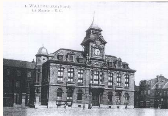
L'Hôtel de Ville à sa construction en 1911

Le bâtiment fut entièrement rénové en 1968 et sa façade modernisée.