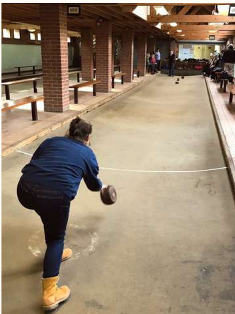
La boule, le jeu traditionnel de Wattrelos

Une des particularités touristiques de Wattrelos réside notamment dans la vivacité de ses jeux traditionnels que sont la boule, le javelot ou encore le tir à l'arc à la perche. Laissez-vous prendre au jeu !