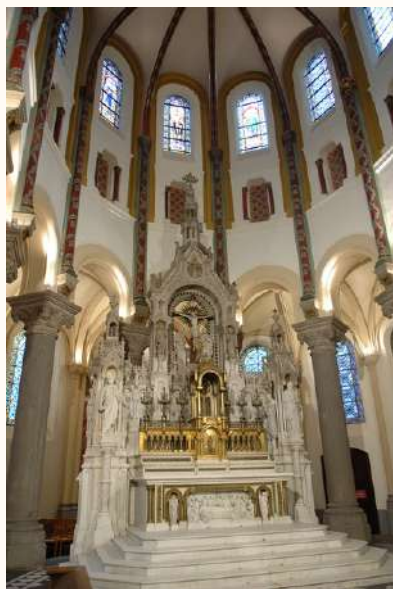
Chœur de l'église Saint-Maclou